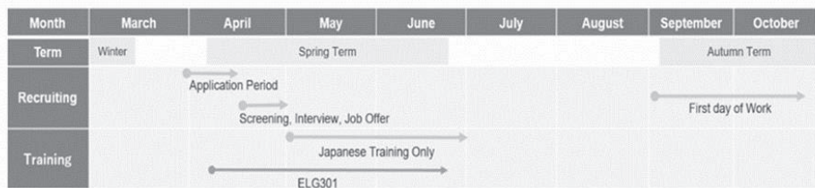
図 1 2021 年春学期の全体スケジュール

新人チューターの採用から研修までの全体スケジュールは、図 1 に示すとおりである。2021 年春学期は英語チューターが十分に確保できていたため、日本語チューターのみ採用、研修を行った。具体的には、まず 4 月上旬に WSD ウェブサイトや学内のポータルサイト上で応募を呼びかけ、4 月下旬に応募者と担当教員（筆者）および WSD スタッフとの面談を行った。そこで採用が決定した新人チューターは、5 月から 6 月にかけて筆者が担当する新人チューター研修に参加した。春学期は、応募者 7 名のうち 7 名全員が採用となり、研修は 2 グループに分かれて行うこととなった。なお、春学期の大学院生の英語チューターの採用は見送られたものの、学部生の英語チューター育成コース (ELG301: The Foundations of Tutoring Academic Writing) は開講されており、チューターを志望する修了者は秋学期以降、English for Liberal Arts Program (ELA) 課題のサポートに限定してチューターの役割を果たしている。