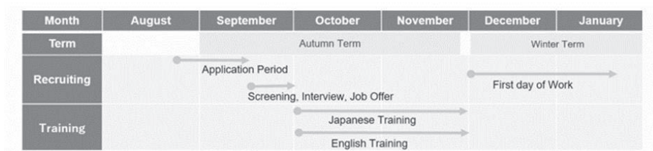
図2 2021年秋学期の全体スケジュール

教員が担当した。秋学期の日本語チューターへの応募は例年少ない傾向があり、2020年度の応募者は3名と少数であったことから、人員の確保が課題である。なお、春学期の日本語チューター志望者が7名と多かった理由は、日本語教育プログラムが冬学期に開講する大学院共通科目「研究者のための論文作成法（日本語）」修了者へのリクルートが功を奏したためである (3) 。